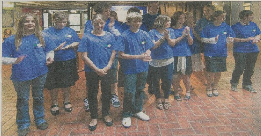
Sie sind eine Firma, jedenfalls ein Teil davon. Schüler der Walter-Erbe-Realschule kümmern sich um Senioren.